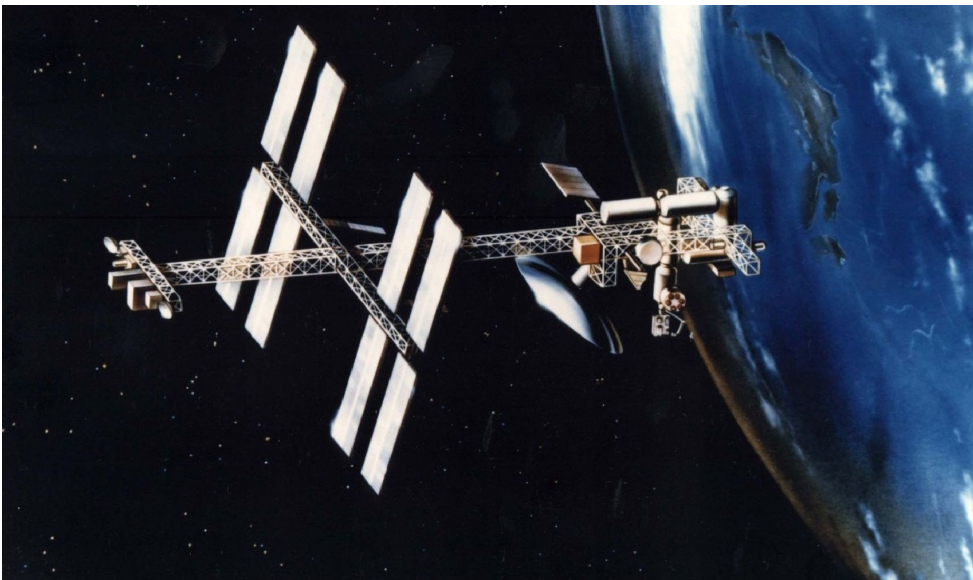
Abbildung 2: Erstes Freedom Konzept: Power Tower

Dieses neue Konzept wurde von der NASA im März 1991 vorgestellt. Die Labor- und Wohnmodule wurden von 13,40 auf 8,20 m gekürzt, die Länge des zentralen Masts von 150 auf 108 m verringert. Die Station sollte nun schon 30 Milliarden kosten, das erste Element sollte im Frühjahr 1996 gestartet werden, die erste Mannschaft Mitte 1997 und im Jahr 2000 sollte die Station fertiggestellt sein. Dieses Konzept bekam aber keine Rückendeckung. So wollte der Senat 1991 die Station sogar ganz einstellen, es gab für diesen Vorstoß aber keine Mehrheit im Repräsentantenhaus. So wurde bei gekürztem Budget die nächsten Jahre weiter geplant, um die Weltraumstation billiger bauen zu können.