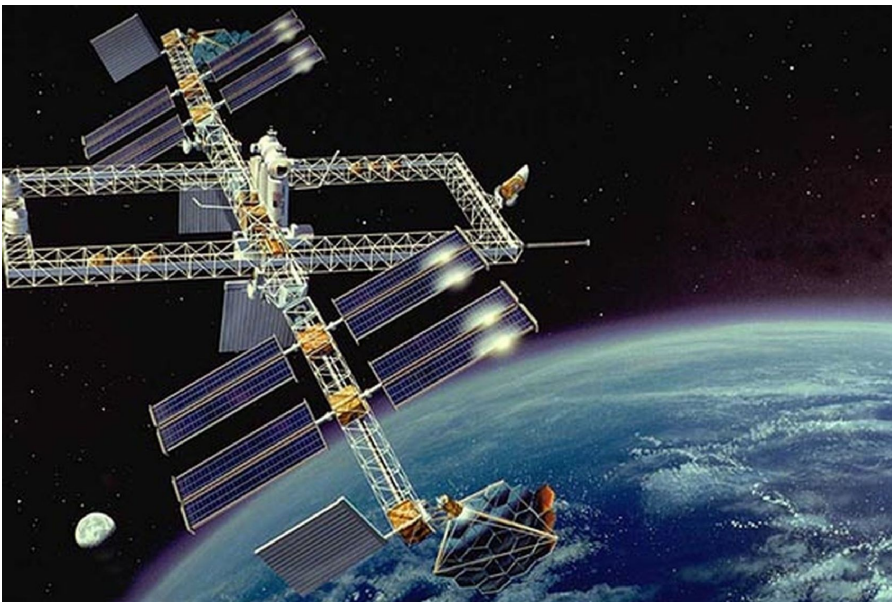
Abbildung 6: Das Konzept des Dual Keel von 1986