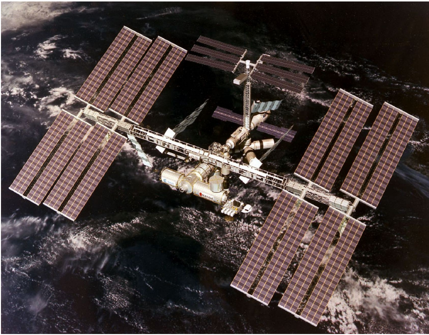
Abbildung 5: Plan der ISS 1995: © der Grafik: NASA