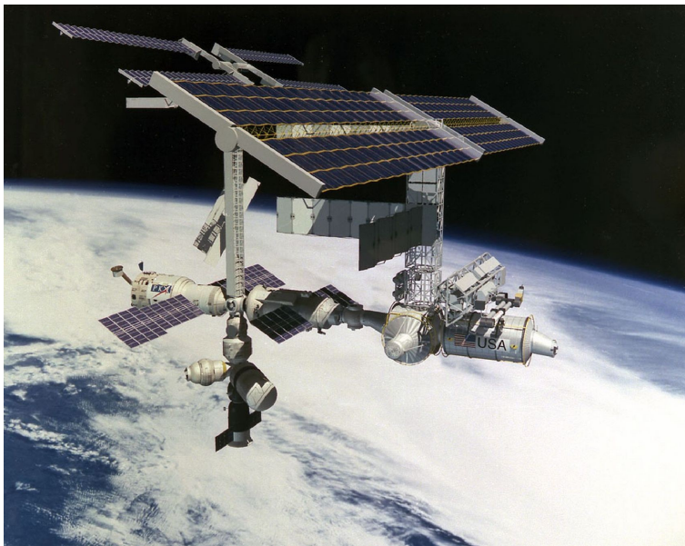
Abbildung 4: Letzte US-Planung von Alpha